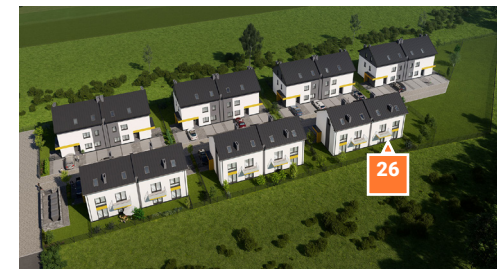
Widok osiedla z lotu ptaka